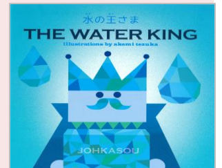
海外向け浄化槽(水の妖精)絵本